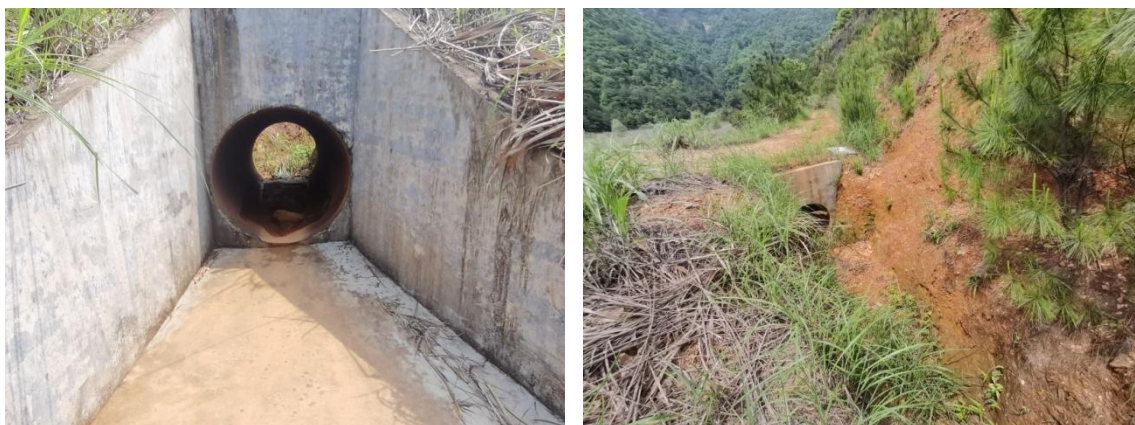
图 2-8 紧急溢洪道