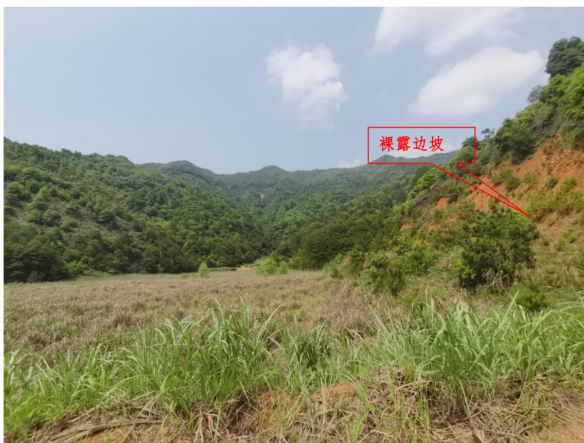
图 2-9 左岸裸露边坡