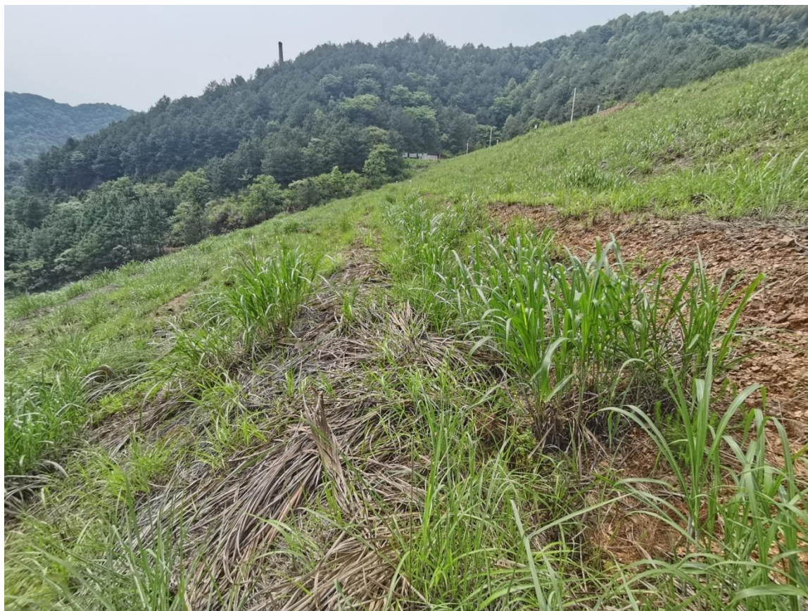
图 2-5 堆积坝下游坝坡