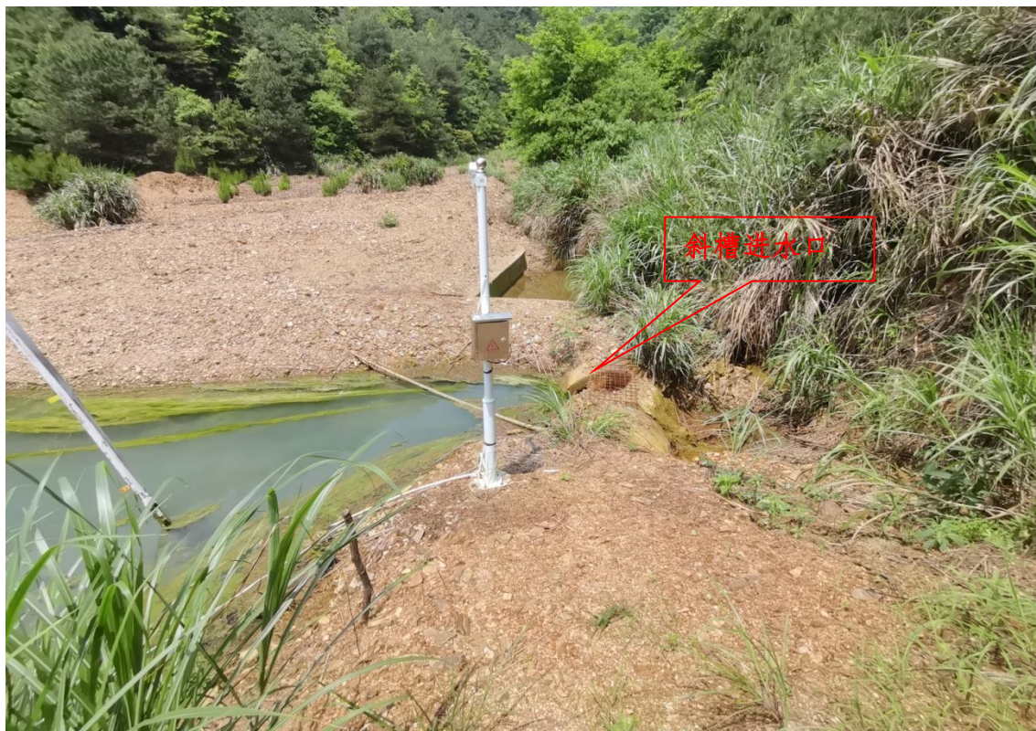
图 2-6 斜槽进水口