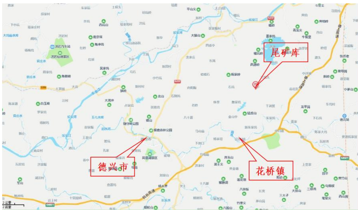
图 2-1 尾矿库地理位置