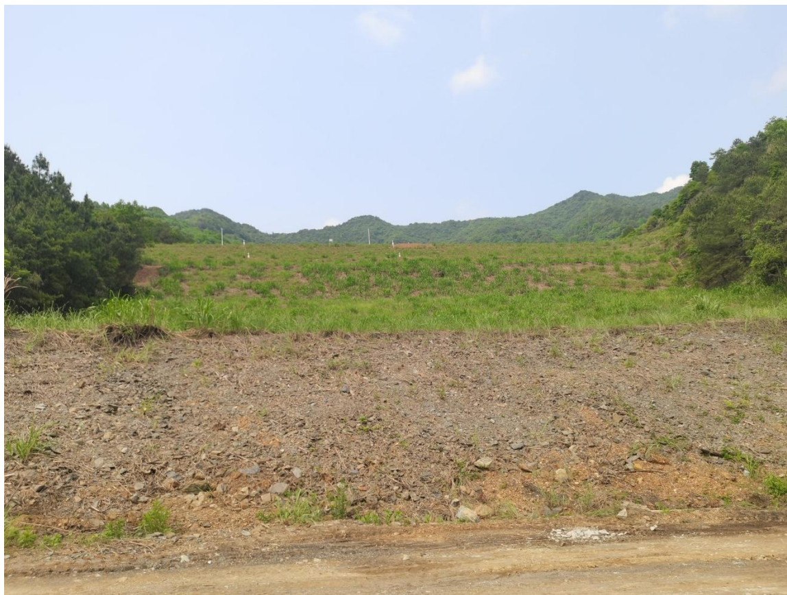
图 2-4 尾矿坝下游