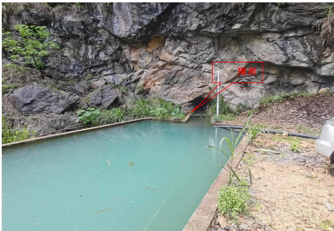
图 2-7 隧洞出口

尾矿坝左坝肩设置有紧急溢洪道，紧急溢洪道由进口段+预制涵管+下游开挖沟渠组成，紧急溢洪道进口底高程为 189.16m，预制涵管内径约 1.1m，下游为沿山体开挖的沟渠。尾矿库左岸进库道路及紧急溢洪道山体侧存在裸