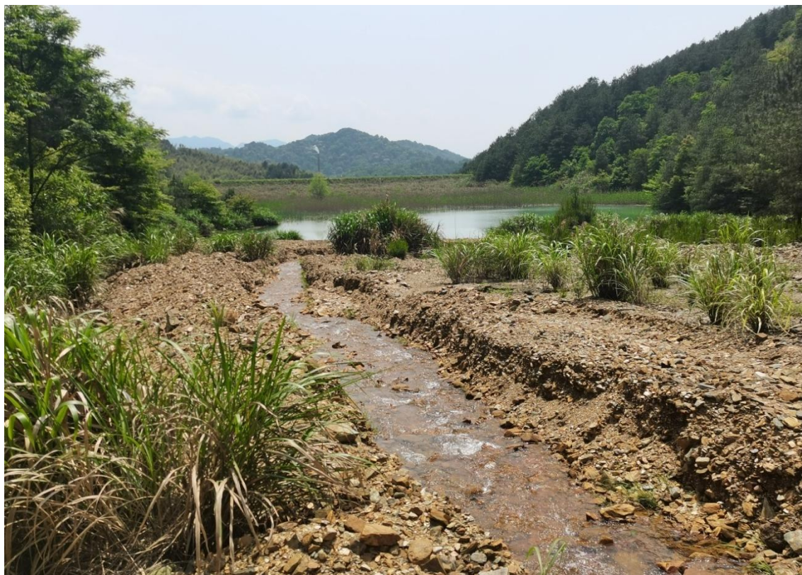
图 2-3 尾矿库现状图（库尾看向尾矿坝）