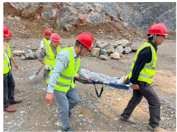
图 2.5-9 应急演练