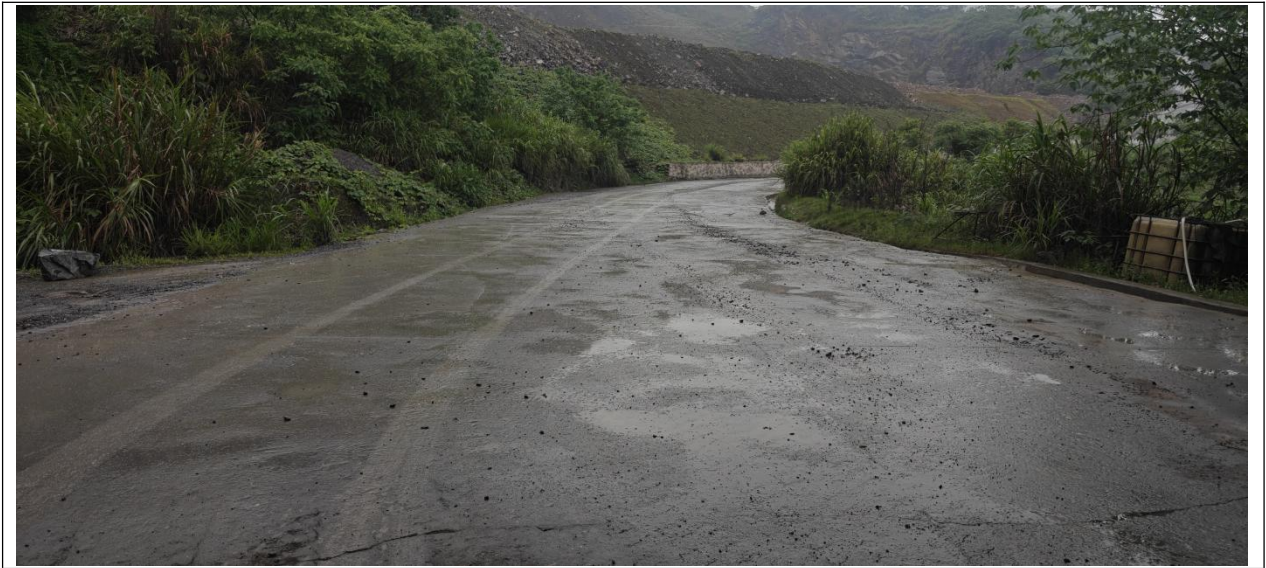
图 2.5-4 矿区运输道路