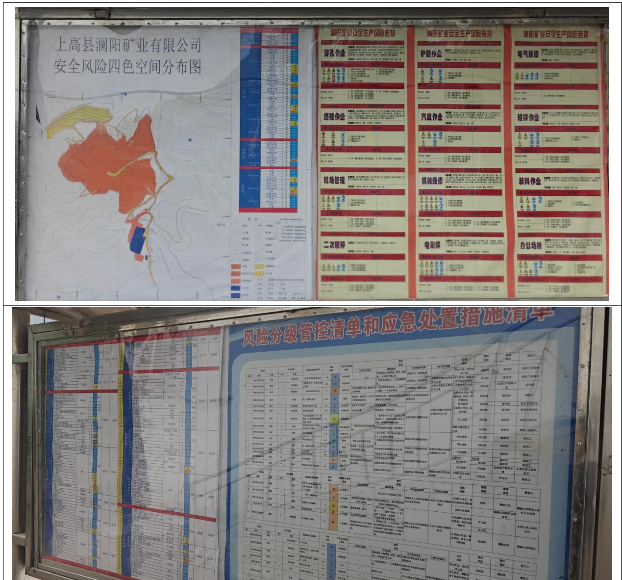
图 2.5-10 一图一牌三清单照片