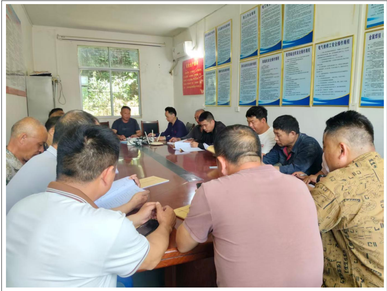
图 2.5-8 安全培训教育