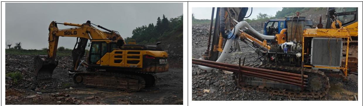
图 2.5-3 矿山生产设备