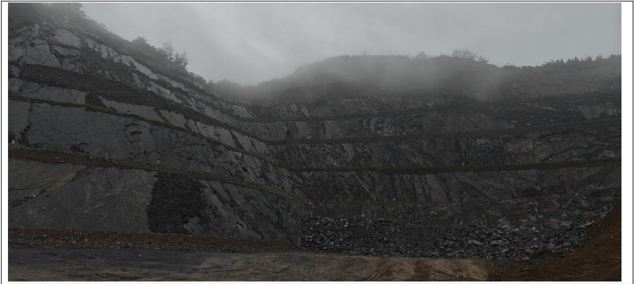
图 2.5-1 采场现状图