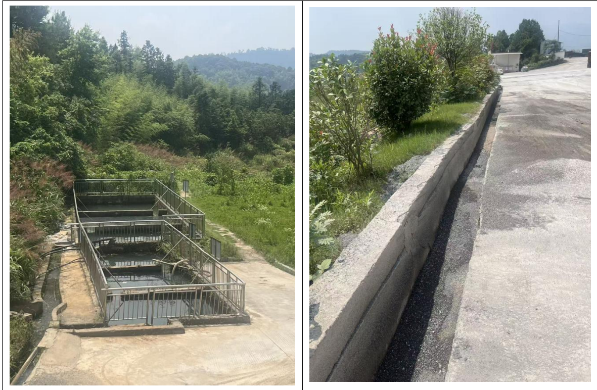
图 2.5-7 防排水设施

在排土场底部和工业场地设置有沉淀池，水沟汇入沉淀池，汇水经沉淀后外排，沉淀池已设置围挡及警示标志。