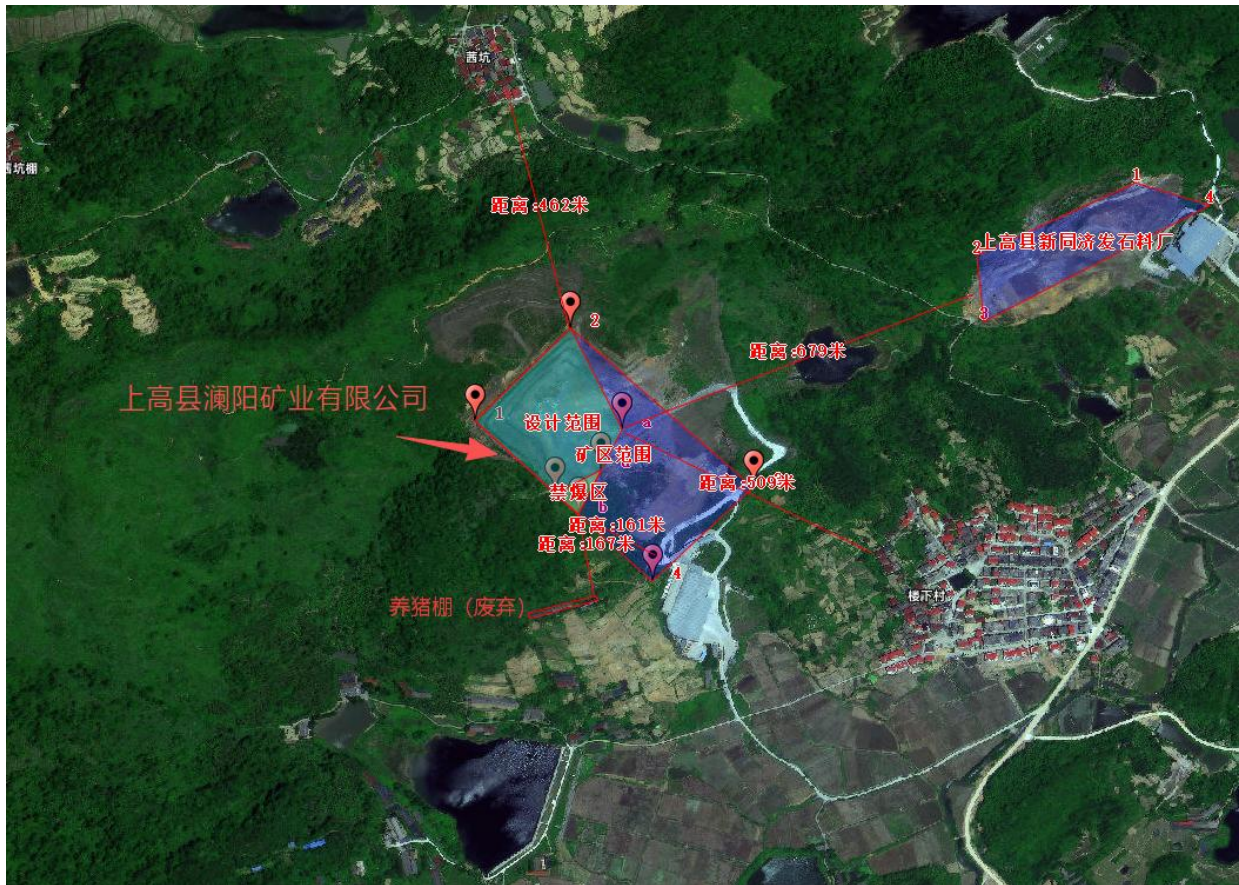
图 2.1-3 矿区周边卫星图