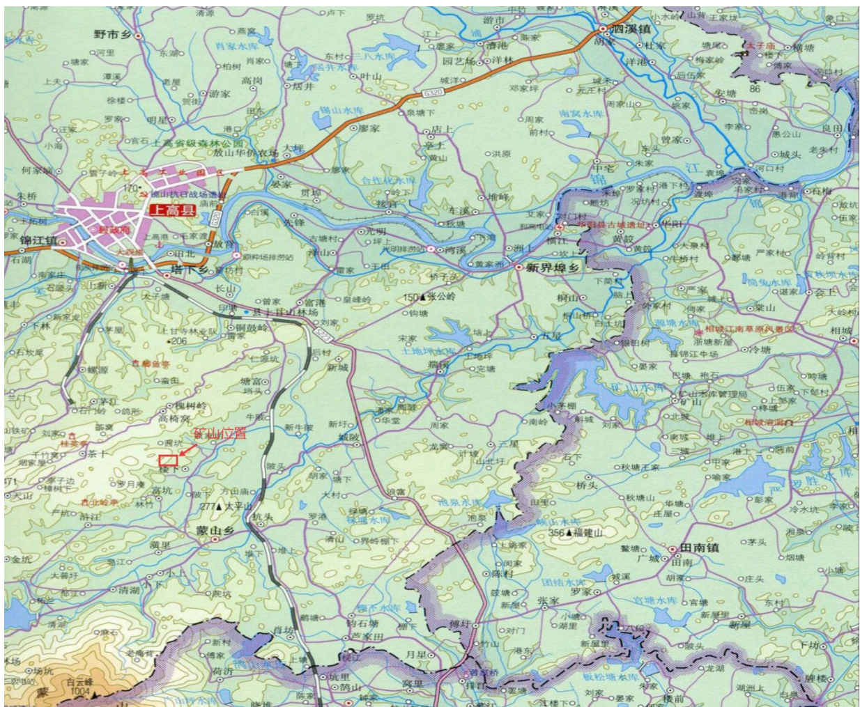
图 2.1-1 矿区交通位置图

矿区地理坐标：东经： 114^\circ 56'40.81'' \sim 114^\circ 56' 59.10'' ，北纬： 28^\circ 8' 57.04'' \sim 28^\circ 9' 13.64'' 。矿区内有简易公路与上高县县城相通，并与 320 国道、浙赣铁路、沪昆高速公路、武吉高速公路相接，交通较为便利。矿区位置详见图 2.1-1。