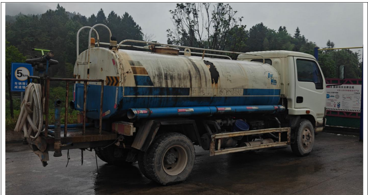
图 2.5-5 矿区防尘设施

矿山为露天开采，利用自然通风，作业人员佩戴防尘口罩，现场配有雾炮机，潜孔钻机穿孔时采用湿式作业，高位移动水箱兼降尘设备供水，配备了 1 辆 5m 3 洒水车。