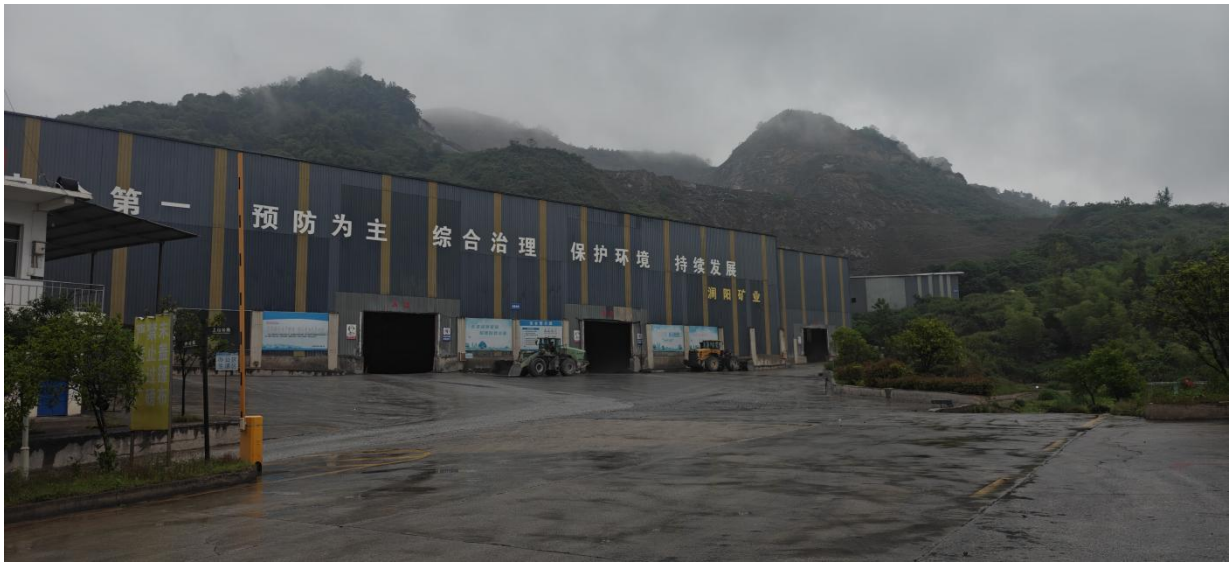
图 2.5-2 办公区及工业场地等设施图