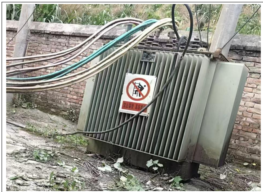
图 2.5-6 变压器